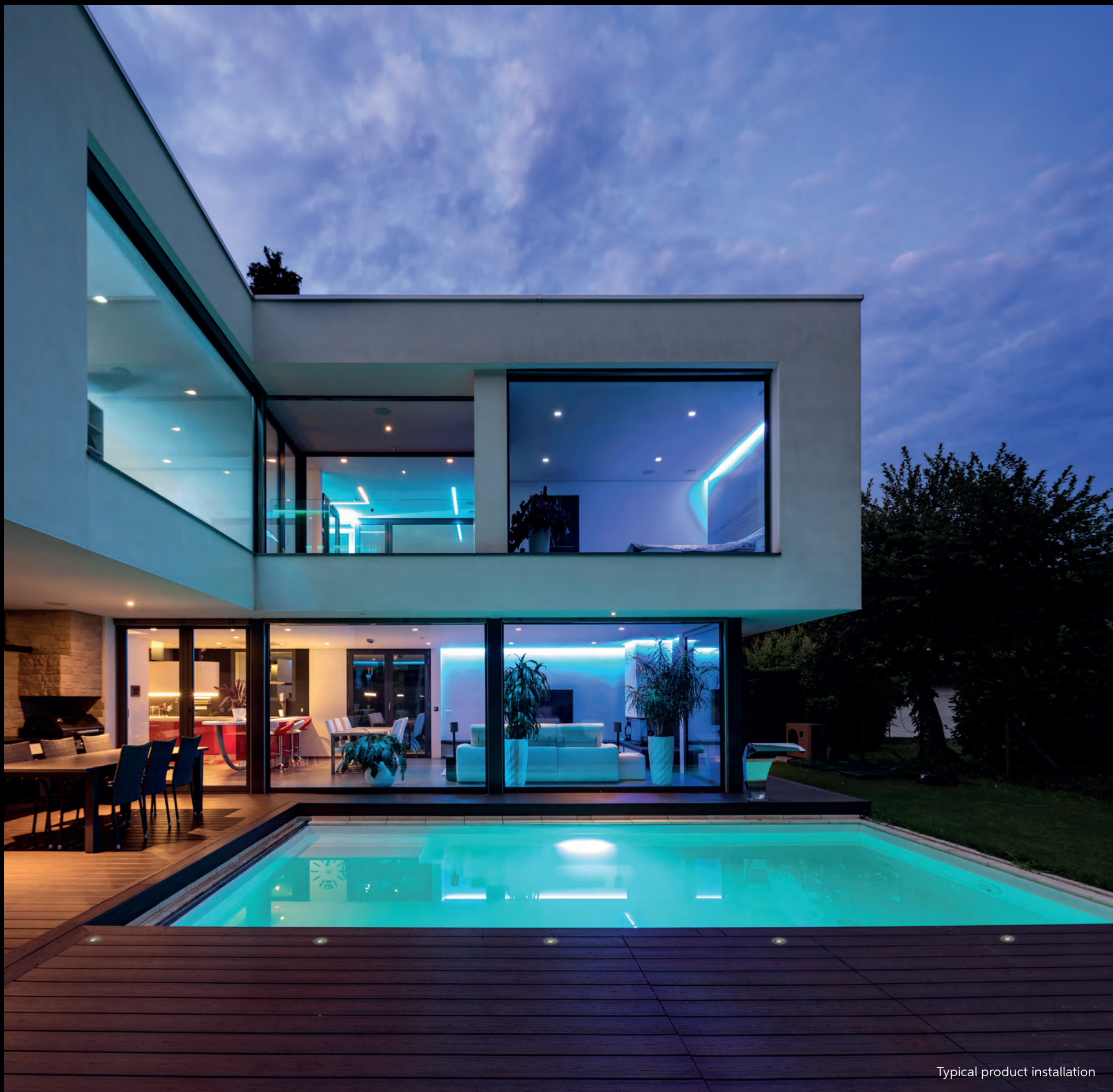
Typical product installation